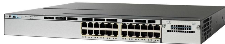
Коммутатор третьего уровня Cisco Catalyst 3750-X