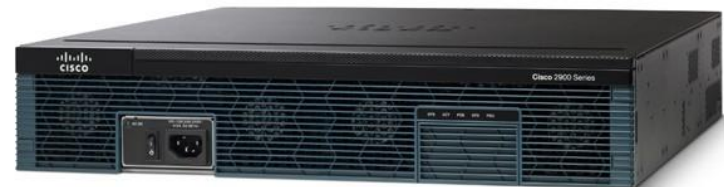
Маршрутизатор Cisco ISR G2 2921